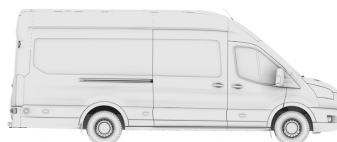
VAN L4H3 (JUMBO 470)

VAN - вантажний фургон N2 (згідно сертифікату) LWB EF (Long Wheel Base Extended Frame - L4 (Jumbo)) - довга колісна база з подовженим кузовом H3 - високий дах RWD - привод на задню вісь